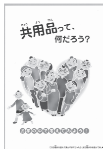
●「共用品って何だろう? 共用品って知ってる?」A5サイズ冊子版

で、子ども達と共に考えてバリアフリー社会に貢献したいと考えています」と話す。本機構では、「指導者用のガイドブック」と共に、子ども向けの小冊子『共用品って何だろう?』を無料配布している。これらを使って、子ども達と一緒に「考えてみてはいかがだろうか。観察力のある子ども達